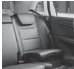
B-Klasse, Fondsitzbank mit integrierten Kindersitzen, Code 248