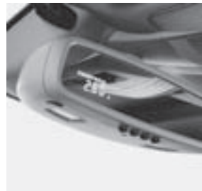
E-Klasse, Taxameter im Innenspiegel, Code 337, Funkmikrofon, Code 938