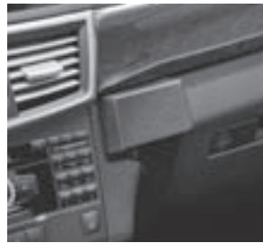
E-Klasse, Taxi-Zubehör Konsole, Code 333