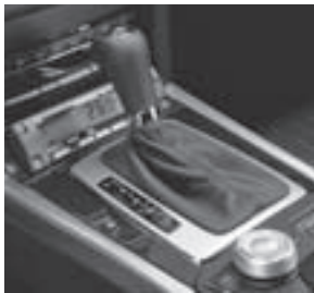
E-Klasse, Taxameterkonsole, Code 336 1)