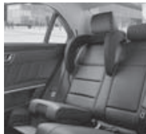
E-Klasse, Fondsitzbank mit integrierten Kindersitzen, Code 248