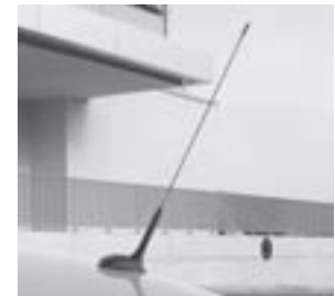
Funkantenne, Code 356