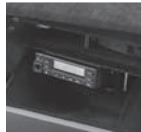
E-Klasse, Funkgerätehalterung im Handschuhfach, Code 334 1)