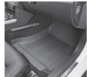
E-Klasse, Wannenauflege- Gummimatten, Code 837