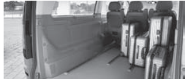
Vito, eine Laderaum-/Bestuhlungsvariante