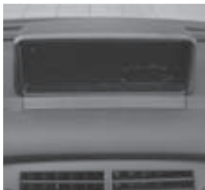
B-Klasse, Instrumententafel mit Haube, Code 336