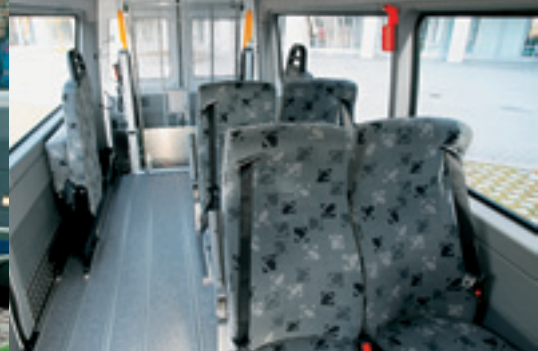
Flexibilität im Innenraum: Beispielhafte Bestuhlung mit 4 festen und 2 drehbaren Klappsitzen, zwischen denen Platz für 2 Rollstühle ist.