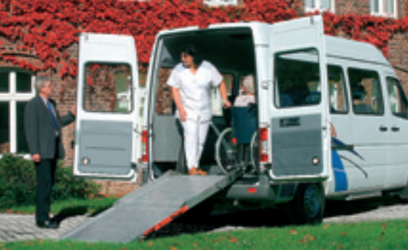
Der Sprinter Mobility: die Rampe ermöglicht es auch Menschen im Rollstuhl, kräfteschonend ein- und auszusteigen.