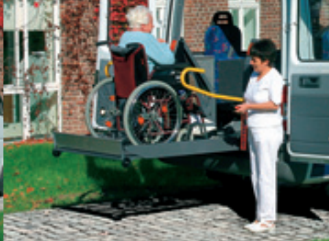
Elektrischer Hublift (Sonderausstattung).