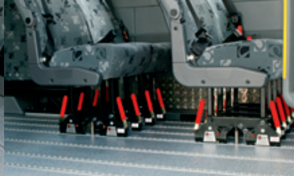
Drehbare Klappsitze schaffen Platz und erhöhen die Variabilität.